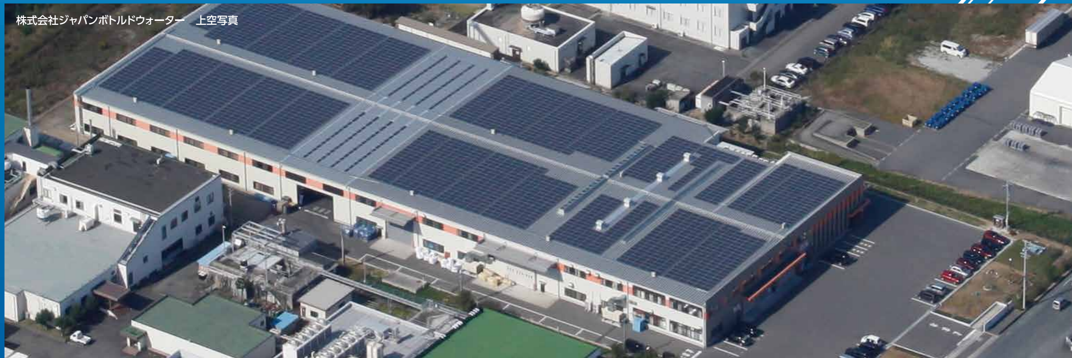
株式会社ジャパンボトルドウォーター 上空写真